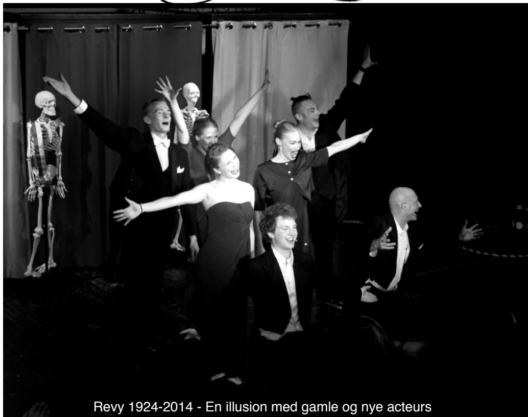
Revy 1924-2014 - En illusion med gamle og nye acteurs