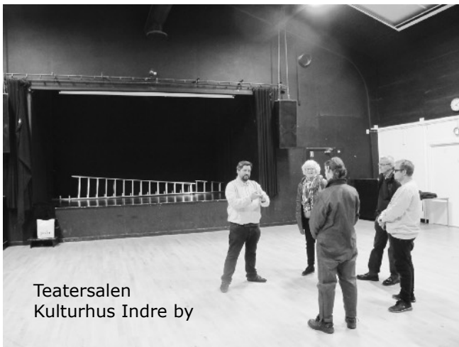
Teatersalen Kulturhus Indre by