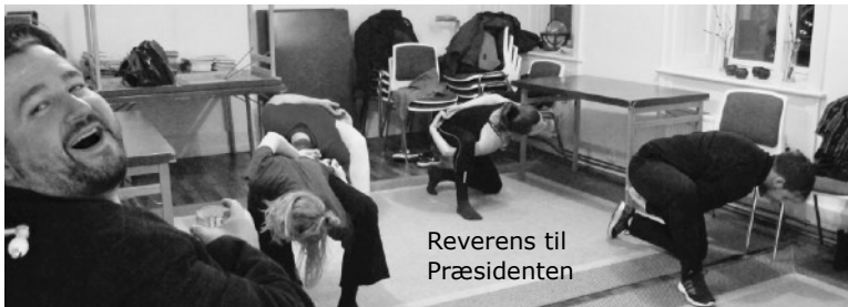
Reverens til Præsidenten

Der bliver næppe tale om nogen undergang, i forbindelse med min afsked, snarere en overgang. Der er allerede en dygtig afløser i kikkerten. Men nu har vi blikket stift rettet mod årets spændende, og ikke mindst nyskabende forestilling, hvor der er sat alle sejl til, med alle mand på dæk. Det er en fremtidsodyssé vi skal på, hvor titlen er intet mindre end " Jorden går under på fredag ".