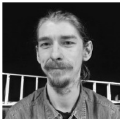
Ny instruktør Revyen 2018 3

Men optimismen og humøret er intakt hos revyholdet 2018