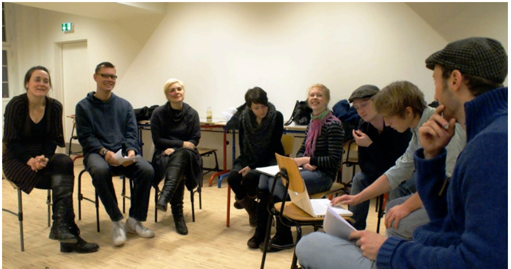
Revyen 2010 - første læseprøve