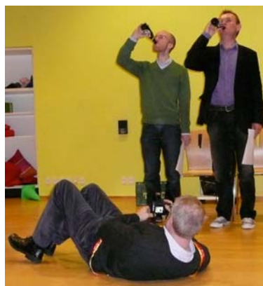
Ekstraordinær optagelsesprøve - det faldt fotografen for