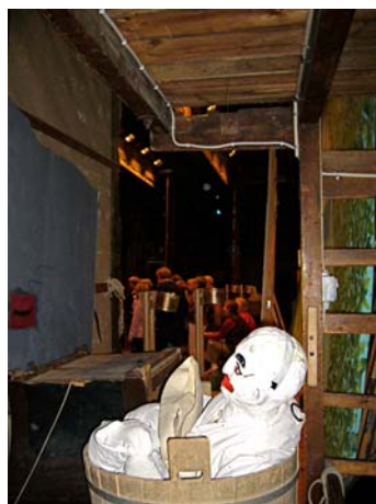
Besøg på Pantomimeteatret